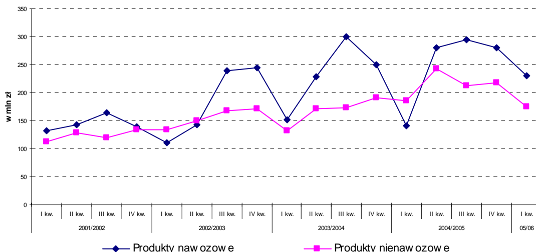
Sezonowość sprzedaży produktów nawozowych oraz nienawozowych

Kwartały podane na wykresie są kwartalami lat obrotowych Spółki.